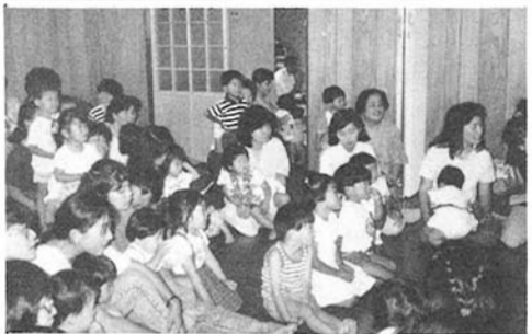
平成元年7月6日 池の内会館

核家族化と若年層の母親の多い昨今、育児に対する不安の解消一筋にと、膳所民生児童委員婦人部が子育てに対する話し合いの場を計画し、昭和六十一年八月より月一回実施しております。