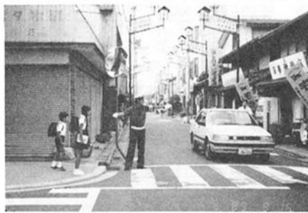
横断する学童を指導する人たち

につとめてまいりました。現在八名のボランティア指導員は、毎月一日・十五日に七時三十分から八時三十分まで交通量の多い登校危険個所で交通指導を行っています。 ○ 膳所神社横交差点 ○ 膳所団地三差路 ○ 北相模町交差点 ○ 中庄駅前交差点