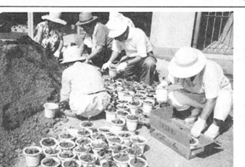
敬老の日のための鉢植えに追われる