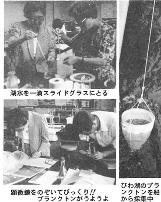
びわ湖のプランクトンを船から採集中