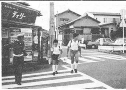
登校途中の学童を守る推進委員