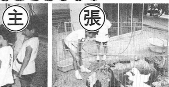
あひるやにわとりに餌をやります

運動会シーズンをひかえて子ども達は、暑い中をかけるこや体操、リズム遊び等の運動遊びにがんばっています。花を植えたり、飼育物に与える野菜を作ったりして、飼育の様な幼稚園教育目標の達成活動も継続して行っています。子ども達が飼育栽培活動に心をこめて取り組んでいます。自然の美しさに感動した「友達と仲よく遊ぶ子ども」「自分から進んで物事に取り組み子ども」「よく考えて楽しく表現する子ども」。