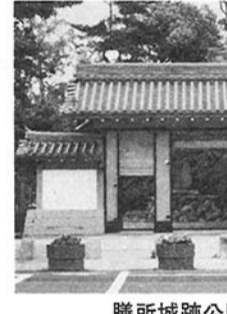
膳所城跡公園の門