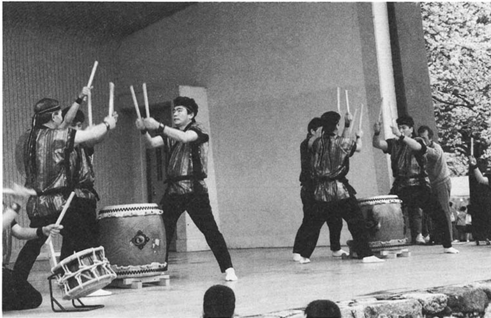
たいこの音にさくらもびっくり!