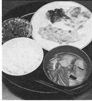
今日の試食のカロリーは 620キロカロリー