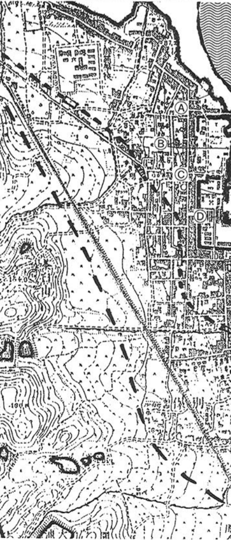
(明治42年頃の膳所の町)