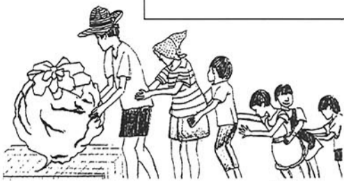
みんなで力を合せ大きなカブを...

の連帯が必要」と助言者が結ばれました。 いじめはいじめの世にもあるが、最近では陰湿化し、特定の者を集中的・継続的・徹底的に集団でいじめる傾向にある。新聞などの報道では、いじめられた方の記事は大きく載るが、いじめる方の事はあまり