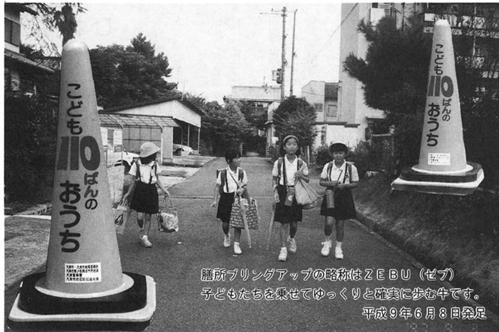
膳所ブリングアップの略称はZEBU(ゼブ) 子どもたちを乗せてゆっくりと確実に歩む牛です。 平成9年6月8日発足