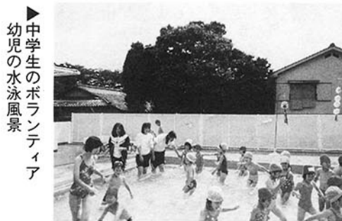
中学生のボランティア 幼児の水泳風景

戦後の学制改革が実施されて五〇年、現在の晴嵐の地に粟津中学校と命名して四八年目を迎へ、はや二万名を越す卒業生を送り出し、先輩諸氏の努力により輝かしい実績の上に立派な校風を誇る粟津中学校に発展してきました。 現在、生徒数五六五名が校訓「自主・自立・自由」のもと、学びとる生徒・思いやる生徒・やり抜く生徒 像を目標に、学校生活を充実させるべく努力しております。 人と人のつながりを大切にすするため、一年生は葛川のふるさと宿泊体験、二年生は比叡山での自然宿泊体験、三年生は長野での修学旅行を取り入れています。 生徒会を中心にボランティア活動として地域の老人との交流や障害者理解教育の計画的な実施、幼児への保育実習等社会福祉への積極的な参加にも努力しております。 部活動においては、市夏季総体で剣道女子・体操男子・バレー女子が優勝し、バスケ男子が準優勝いたしました。