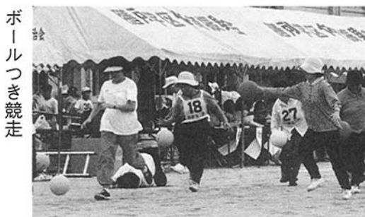
各町こども会対抗玉入れ ボールつき競走