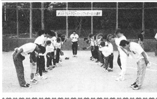
膳所学区市民運動会スナップ