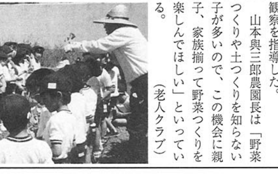
一年生児童にサツマイモの苗植えを指導

こんな記録を読んだあとに「膳所神社」に参詣してみますと、境内には明治年間建立のものですが、「膳所倭大明神」と刻まれた石碑がありました。主祭神が「豊受大神」であるのみでなく、わざわざ「膳所倭大明神」としたのは、郷土の歴史の「こま」のように思えるのです。