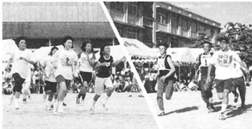
1000m マラソン 600m リレー