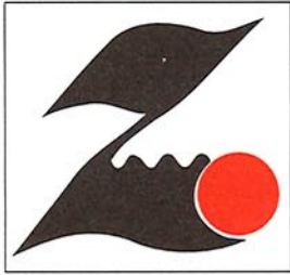
膳所学区シンボルマーク