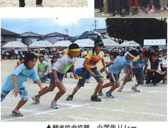
▲観光協会協賛 小学生リレー