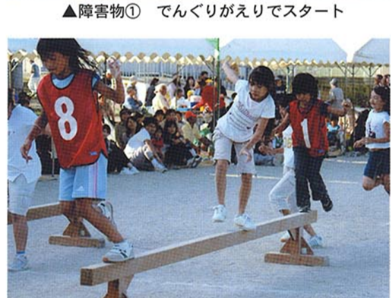
▲障害物② 落ちたらだめよ、平均台