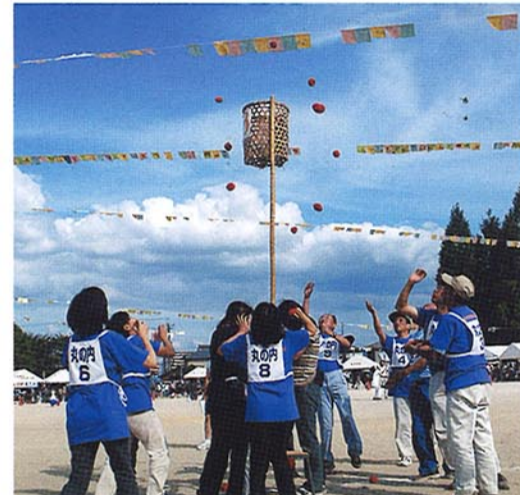
自治会対抗五入れ