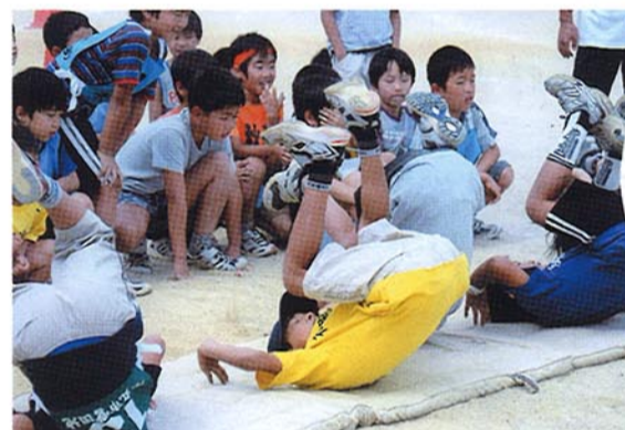
▲障害物① でんぐりがえりでスタート