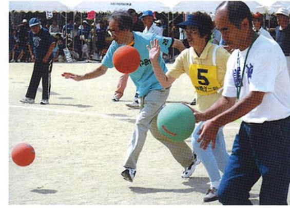
▲50才以上のボールつき