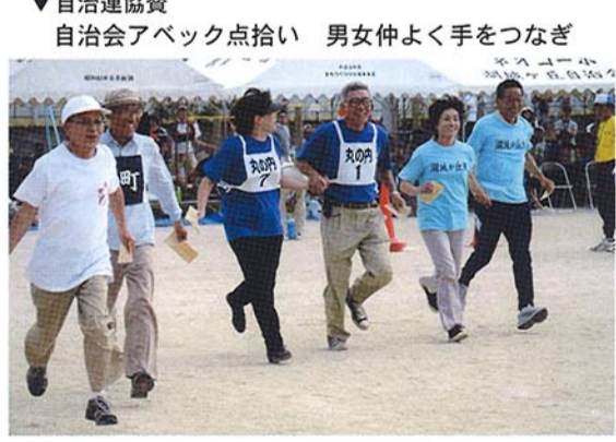
▼自治連協賛 自治会アベック点拾い 男女仲よく手をつなぎ