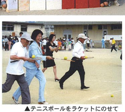
▲テニスボールをラケットにのせて (来賓と60才以上)