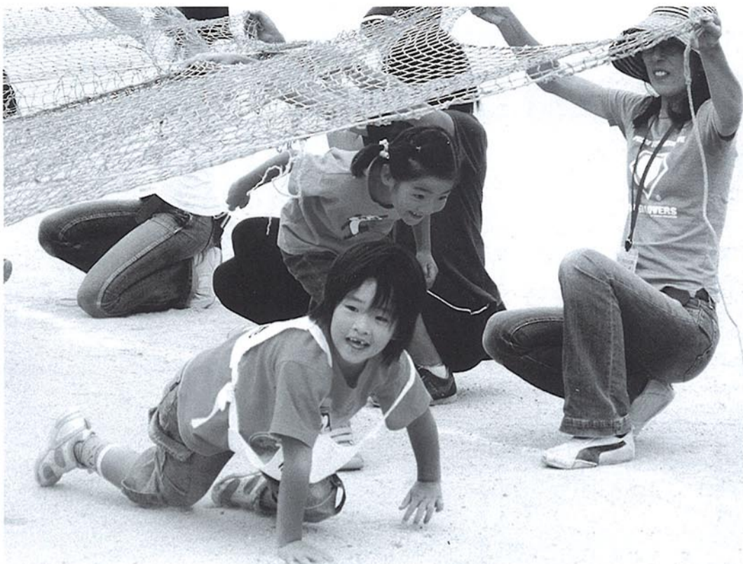
障害物競走のあみくぐり

膳所まちづくり委員会では、9月16日に「膳所城下町めぐり実行委員会」を発足し、膳