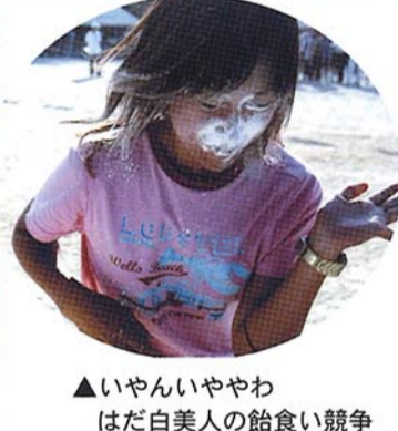
▲いやいややわ はだ白美人の飴食い競争