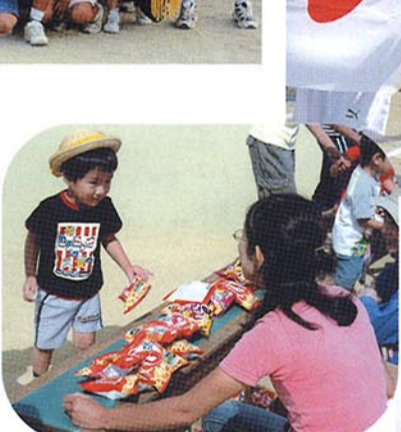
▲かっぱびせんがほしいよ 宝拾い