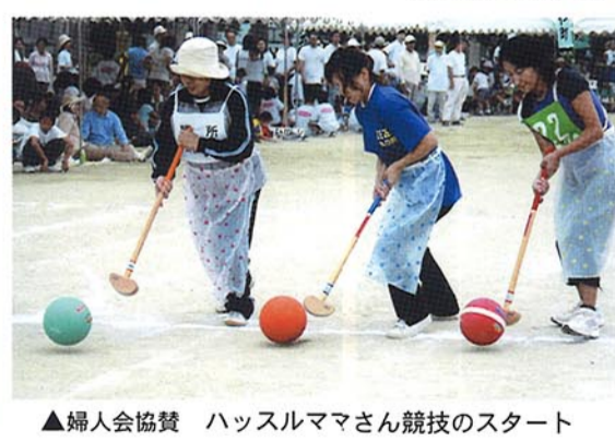
▲婦人会協賛 ハッスルママさん競技のスタート