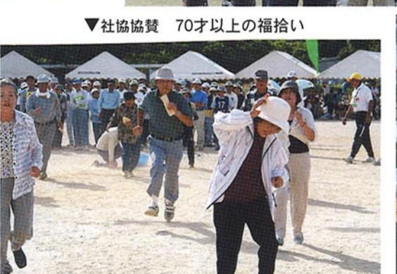
▼社協協賛 70才以上の福拾い