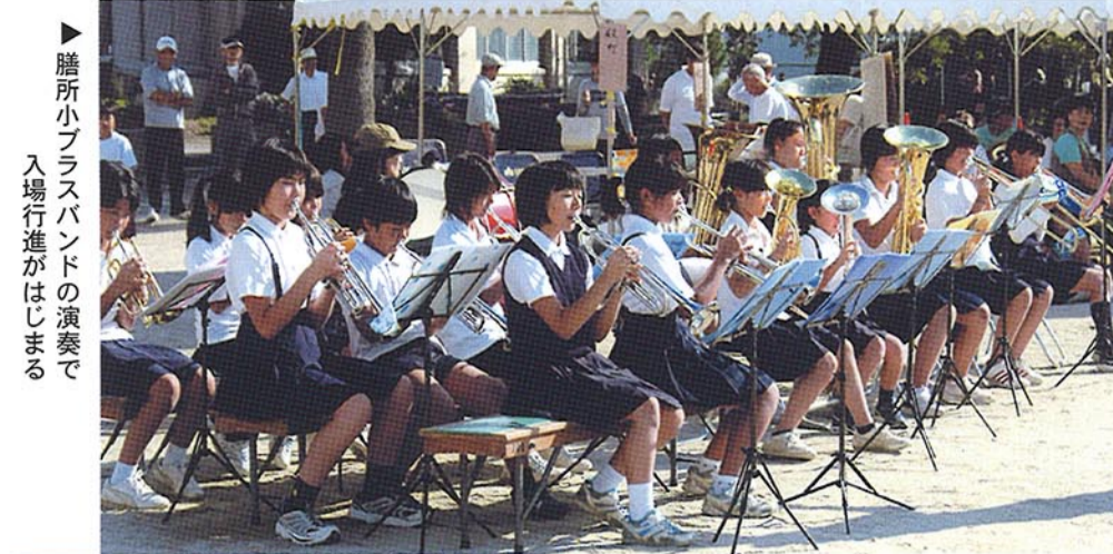
膳所小フラスバンドの演奏で 入場行進がはじまる