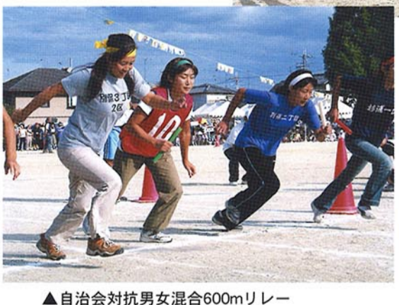
▲自治会対抗男女混合600mリレー