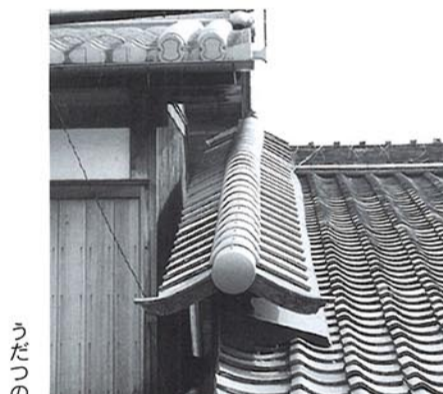
うだつのある屋根

体験コース 長養窯陶芸絵つけ体験 希望者のみ 別途料金。参加申込 膳所市民センター前案内所 (当日受付) 前売 大津市観光協会 (JR大津駅2階) モデルコース ゆっくり歩いて2時間半 膳所神社↓遵義堂跡 (膳所高校) ↓膳所市民センター (膳所歴史資料室秋季特別展、膳所うまいもん市) ↓膳所城跡公園 ↓篠津神社↓記念寺「蘆花浅水荘庭園」(有料・城下町めぐりチケットが便利) ↓膳所焼美術館 (有料・城下町めぐりチケットが便利) ↓本多神社 (特別公開 城下町めぐりチケットを提示) 本多神社資料館・子授かり地藏 ↓若宮八幡宮 ↓「有料・長養窯絵付け体験」 ↓旧東海道のまち (ばったん床几、うだつ) ↓菅