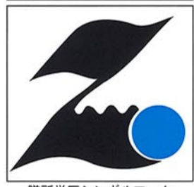
膳所学区シンボルマーク