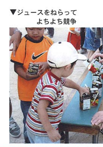
ジュースをねらって よちよち競争