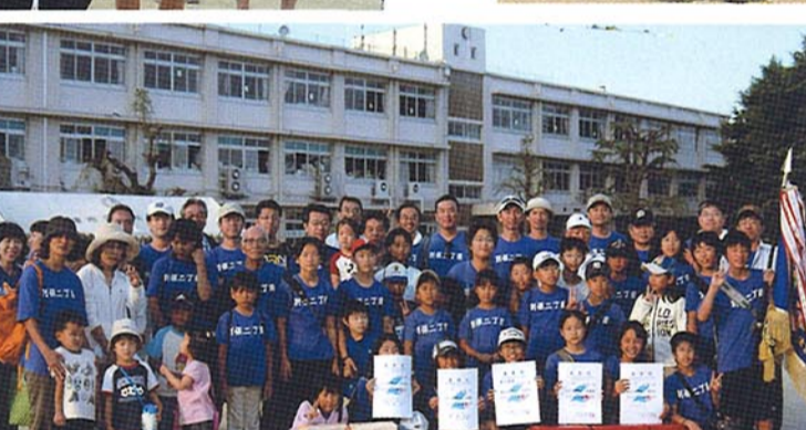
▲1部優勝 別保二丁目