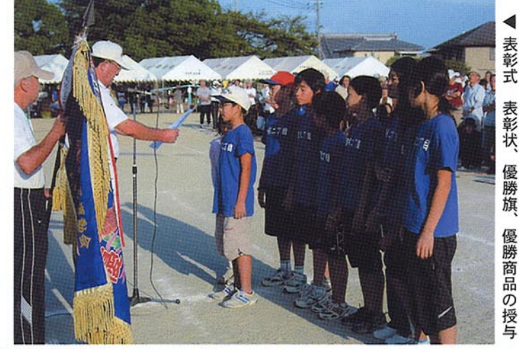
表彰式 優勝旗、優勝商品の授与