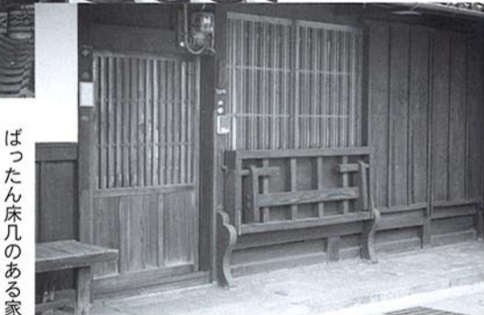
ばったん床几のある家

体験コース 長養窯陶芸絵つけ体験 希望者のみ 別途料金。参加申込 膳所市民センター前案内所 (当日受付) 前売 大津市観光協会 (JR大津駅2階) モデルコース ゆっくり歩いて2時間半 膳所神社↓遵義堂跡 (膳所高校) ↓膳所市民センター (膳所歴史資料室秋季特別展、膳所うまいもん市) ↓膳所城跡公園 ↓篠津神社↓記念寺「蘆花浅水荘庭園」(有料・城下町めぐりチケットが便利) ↓膳所焼美術館 (有料・城下町めぐりチケットが便利) ↓本多神社 (特別公開 城下町めぐりチケットを提示) 本多神社資料館・子授かり地藏 ↓若宮八幡宮 ↓「有料・長養窯絵付け体験」 ↓旧東海道のまち (ばったん床几、うだつ) ↓菅