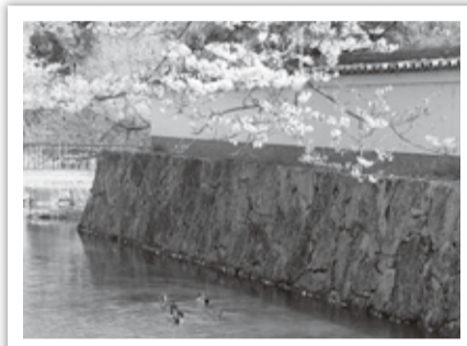
令和3年膳所桜まつり 写真コンクール入選作品 撮影 田中勇一さん

計画では、コロナ感染対策の上でのフリーマーケットや野点茶会、ステージ発表のほか昨年引き続き写真コンクールなども実施されます。詳しくは膳所まちづくり委員会で作成される広報物等でご確認ください。なお、コロナの感染拡大や荒天などの気象条件により膳所城跡公園内での催しは中止になる場合があります。