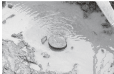
北の丸発掘調査関連工事の際の湧き水(平成24年)

その周りにはきれいな水にしか生息しないアカハラと呼ばれるイモリやカワムツもいました。公園の弁天さんの北側には、昔は棧橋があり、膳中（現膳所高校）の学生たちがよく泳いでいましたが、そこにも冷たい水が何カ所か湧き出ていました。10年前にも、北の丸の発掘調査の現場で、水がぽこぽこ湧き出ているのを見つけて、膳所の歴史に詳しいTさんに急いで報告に行きました。今もきっと湖のどこかで生水は湧き続けているはずです。