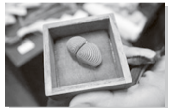
本多神社膳所藩資料館所蔵 風外作「蛭」

現在、蘆花浅水荘の歴史的価値を後世に伝え、春拳の願いを次代に引き継ぐため、様々な分野の人たちが集まり「春縁会」を組織しているほか、滋賀銀行膳所支店の皆さんが庭園の草引きボランティアにも参加しておられるそうです。