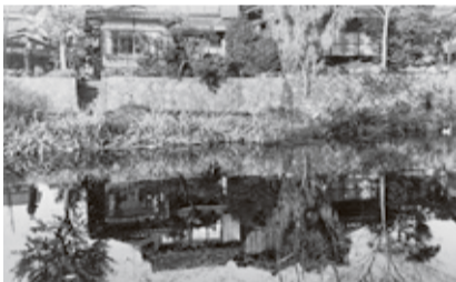
膳所城跡公園前に残されていたお堀現在は埋め立てられて県道に(昭和30年代)

湧き水のことを生水といいます。現在の膳所城跡公園の駐車場や県道あたりは60年程前までは膳所城の堀跡になっていて、そこに架かる石橋からいくつもの生水を見つけることができました。生水は堀の真菰に新鮮な酸素と栄養を補給し、